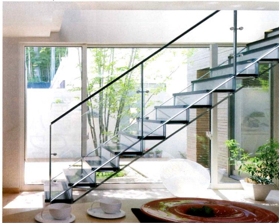
階段としての強さと、インテリアとしての美しさを両立させたトラスタイプ。サイドビューの薄さは、強度の優れたスチール製ならではのメリット。吹き抜けなど開放的な空間を階段の存在感が損ねることなく、遊び心のある自由な発想の住まいを実現する。(参考価格:2,380,040円)

3次元曲線が優美ならせん階段 強度とデザイン両立のつり階段 一坪タイプで狭い間取りもOK