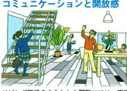
コミュニケーションと開放感

リビング階段を中心とした間取りには、家族の間に心地よいコミュニケーションが生まれる