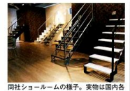
同社ショールームの様子。実物は国内各地の住宅展示場でも見ることができ

同社ショールーム：埼玉県東玉郡美里町東部116 TEL.03-5812-2291 (東京本社) 公開時間9:00~17:00 (土・日・祝・年末年始休業)、日本全国の住宅展示場にて同社の階段を使ったモデルハウスを見学できる。詳細は同社HP内TOPページ「実物を見てみたい」をクリック。