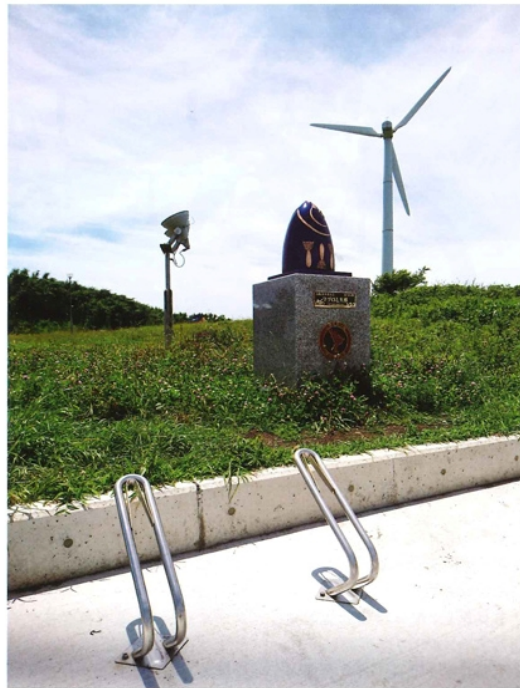
神奈川県三浦市三崎町・宮川公園内のマイルストーンの脇に設置されたD-NAのサイクルスタンド、Clip

三浦半島の4市1町(横須賀市、鎌倉市、逗子市、三浦市、葉山町)から成る三浦半島観光連絡協議会は、自転車で三浦半島を訪れた観光客に半島内を周遊してもらうために、2016年2月、半島内の景勝地8カ所に記念撮影用モニュメントのマイルストーンを設置した。そのうちのひとつ、神奈川県三浦市三崎町・宮川公園内のマイルストーン「マグロと大根」のそばには、D-NAのClipが設置された。D-NAは風車が回るスタイリッシュな宮川公園内の景観にピッタリ調和。訪れるサイクリストにも好評だ。