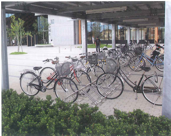
モダンデザインが印象的な飯能市立図書館に設置されたD-NA

デザイン・意匠にこだわり、ものづくりを続けるカツデンアーキテックが生み出したサイクルスタンド「D-NA(ディーナ)」。街の景観を引き立てるような美しいデザインが目ざされ、役所や図書館、公園といった公共施設や一般住宅などで採用が増えている。