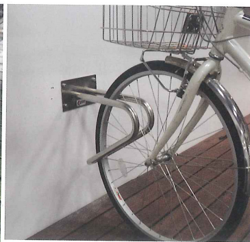
タイヤを挟み込むスタイルのClipタイプは床付と壁付の2タイプ