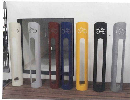
豊富なカラーバリエーションがあるPMタイプ