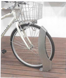
「CESTA」は1枚の板で構成されている。スペインのデザイン事務所とのコラボ第1弾

同社の高度な製品開発力はコミュニティサイクルのポートづくりにも活用されていることも付記しておきたい。