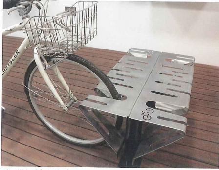
ベンチとして座ることができ、かつ自転車も止められる「SitBike」