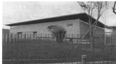
「カツデンアーキテックベトナム工場」

すでに国内事業全体の6割を占める主力分野である室内階段事業は、設計、製作、施工、営業のすべての部門で高い専門性が求められ、何よりも人材の育成が優先される。実習生を受け入れた経験からも、ベトナムでは若くて優秀な人材が確保できる。そのうえに人件費も中国やタイに