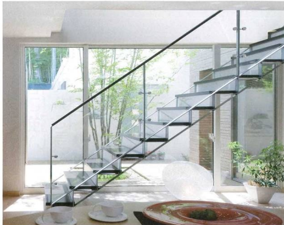
階段としての強さと、インテリアとしての美しさを両立させたトラスタイプ。サイドビューの薄さは、強度の優れたスチール製ならではのメリット。吹き抜けなど開放的な空間を階段の存在感が妨げることなく、遊び心のある自由な発想の住まいを実現する。(参考価格：2,380,040円)

3次元曲線が優美ならせん階段 強度とデザイン両立のつり階段 一坪タイプで狭い間取りもOK