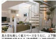
見た目美しく省スペースなうえに、上下階の連続性が生まれる。(参考価格：1,388,880円)

3次元曲線が優美ならせん階段 強度とデザイン両立のつり階段 一坪タイプで狭い間取りもOK