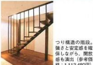
つり構造の階段。強さと安定感を確保しながら、開放感も演出。(参考価格：1,113,480円)