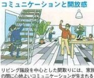
コミュニケーションと開放感

リビング階段を中心とした間取りには、家族の間に心地よいコミュニケーションが生まれる。