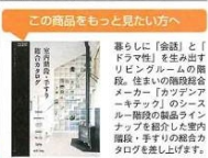
この商品をもっと見たい方へ

暮らしに「余味」と「ドラマ性」を演出するリビングルームの階段。住まいの階段をメーカー「カツデンアーキテック」の「スチール階段」が得意な理由を詳しく紹介した室内階段・手すりの開発カタログを差し上げます。