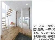
スチールの折り返し階段。一坪タイプでも取りまわり、リフォームにも対応可能。(参考価格：1,401,840円)