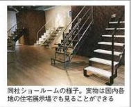
同社ショールームの様子。実物は国内各地の住宅展示場でも見学することができる。

同社ショールーム：埼玉県東武東上線 町木部116 TEL:03-5812-2291 (東京本社) 公開時間9:00~17:00 (土・日・祝・年末年始休業)。日本全国の住宅展示場にて同社の階段を使ったモデルハウスを見学できる。詳細は同社HP内TOPページ上「実物を見てみたい」をクリック。