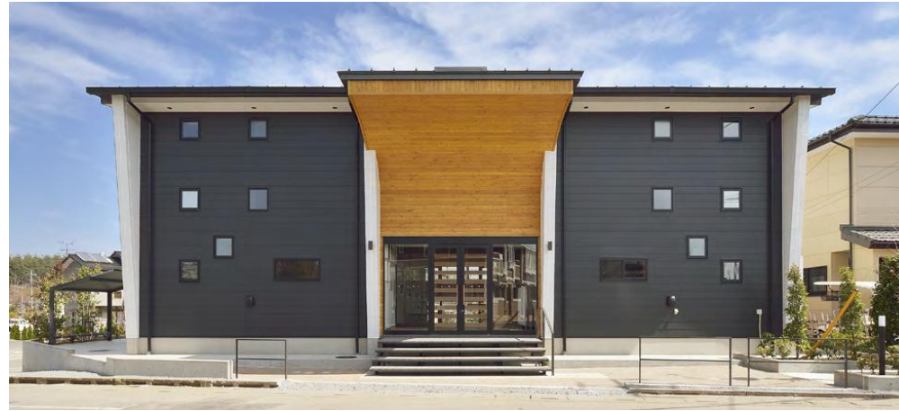
外観(正面) APPROAD / DesignFrame