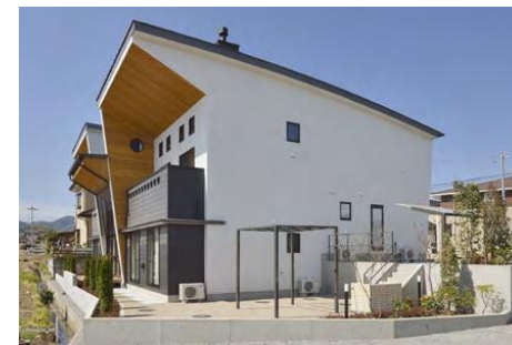
外観(側面) D-NA DELTA / サイクルポート