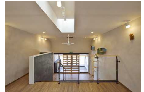
2F 渡り廊下 DEROUS 吹抜け手すり / NeconoMa(House・Step)