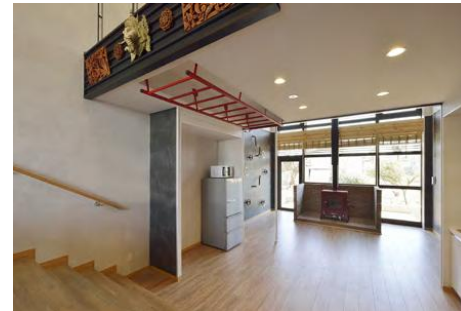
1F 共用スペース DEROUS 壁付け手すり / NeconoMa(Leaf) / AthleticSeries(うんてい・のほり梯)