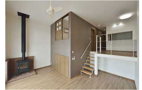
2F 居室(ファミリールーム) HOMRA / ObjеA サンダー(特注仕様) / ObjеA 吹抜け手すり / ObjеA 壁付け手すり