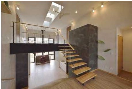
1F 共用スペース DEROUS / NeconoMa(Leaf)